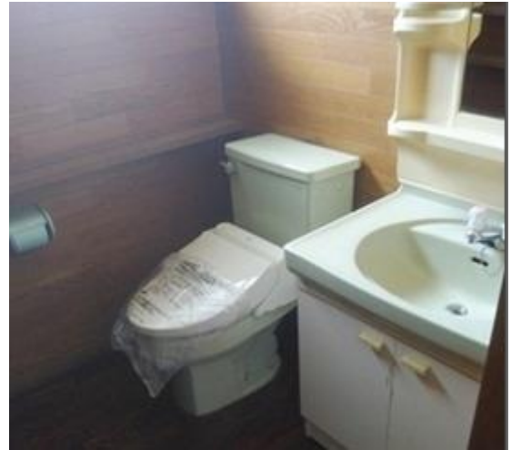
2階 トイレ・洗面所