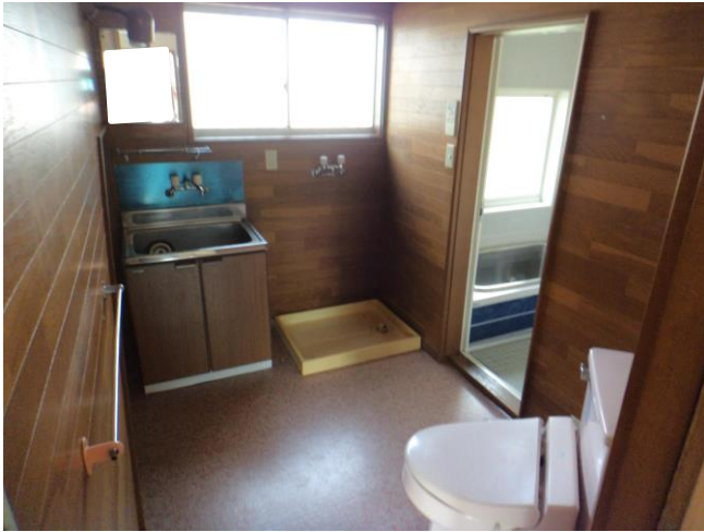
1階 トイレ・洗面所